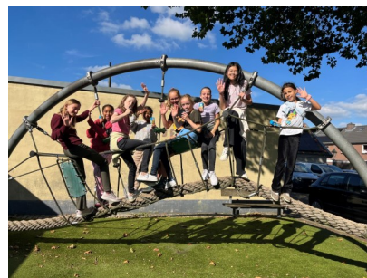
Bij het Touwmuseum, Oudewater.

Na het eten volgde een eerste repetitie. Daarna een prachtige film: 'Les Choristes', over een leraar, die op een kostschool voor moeilijk opvoedbare jongens een koor opricht en de jongens zingen leert.