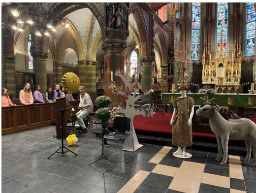
Meewerken aan de Sint Franciscus-viering in de Franciscuskerk

In de kerk staat Franciscus met z'n ezel klaar voor de viering van zondag. Ook is er een mooie zon en veel bloemen. Het ziet er allemaal heel mooi uit.