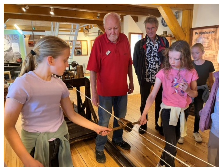
Zelf een touw maken op de lijnbaan.

Bezoek dan dit leuke museum in Oudewater.