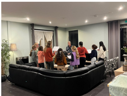
Repetitie in de huiskamer.

Vertrek vrijdag 4 oktober rond 17.00 uur en na aankomst in de Hoengaerde -de bedden waren gauw verdeeld en opgemaakt- kon er nog heerlijk buiten gespeeld worden. We boften het hele weekend enorm met het weer.