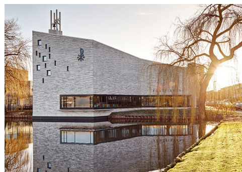
Fonteinkerk, Terbregseelaan 3, Rotterdam