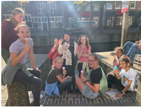
Na het museumbezoek een ijsje!

Na het museumbezoek is het tijd voor een ijsje en lopen we naar de Franciscuskerk voor een generale repetitie.